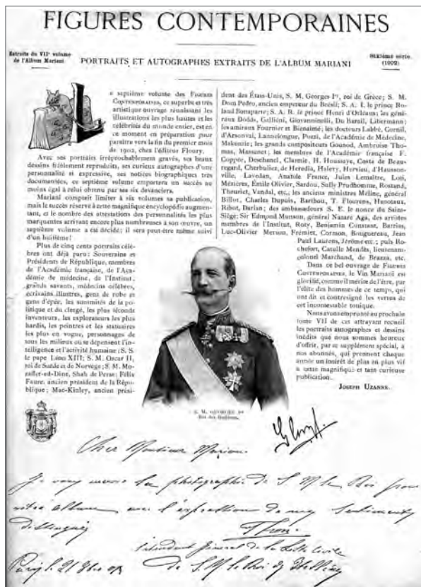
ΕΙΚΟΝΑ 5. Αυτόγραφο του Γεωργίου Α΄ Γλυζμπούργκ στο λεύκωμα Μαριανί [Figures contemporaines tirées de l'Album Mariani, 1902 (Προσωπική συλλογή)]

πολλές χώρες είχαν ήδη παρατηρηθεί και εξωιατρικές χρήσεις της ουσίας: στα τέλη της δεκαετίας του 1880 και κατά τη δεκαετία του 1890 η κατανάλωση κοκαΐνης άρχισε να διαδίδεται στις μαύρες κοινότητες των ΗΠΑ. 65 Την ίδια περίοδο, οι καταγεγραμμένες χρήσεις της ουσίας στην Ελλάδα ήταν ακόμα ιατρικής φύσεως, κυρίως για τις αναισθητικές της ιδιότητες, 66 ή βρίσκονταν στην γκρίζα ζώνη μεταξύ θεραπείας και τέρψης, καθώς στην αγορά κυκλοφορούσαν διάφορα σκευάσματα που περιείχαν κρασί και εκχύλισμα φύλλων κόκας. Μάλιστα, μία από τις προσωπικότητες που προσυπέγραφαν το διαφημιστικό λεύκωμα του πιο διάσημου από αυτά τα τονωτικά, του οίνου Μαριανί, ήταν και ο βασιλιάς της Ελλάδας Γεώργιος Α΄ (Εικ. 5).