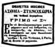
ΕΙΚΟΝΑ 2. Διαφήμιση (ινδικών σιγαρέττων) Grimault με ινδική κάνναβη [Ακρόπολις, 14.12.1904: 2 (Ψηφιακή Συλλογή BBE)]